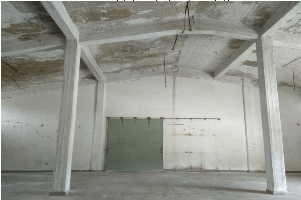
Εικόνα 4: Εσωτερική άποψη αποθήκης 1