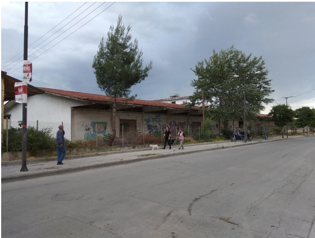
Εικόνα 2: άποψη αποθήκης 4 από οδό Παιωνίου