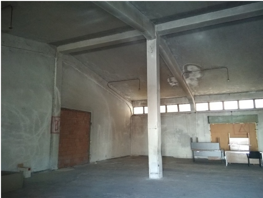
Εικόνα 5: Εσωτερική άποψη αποθήκης 4