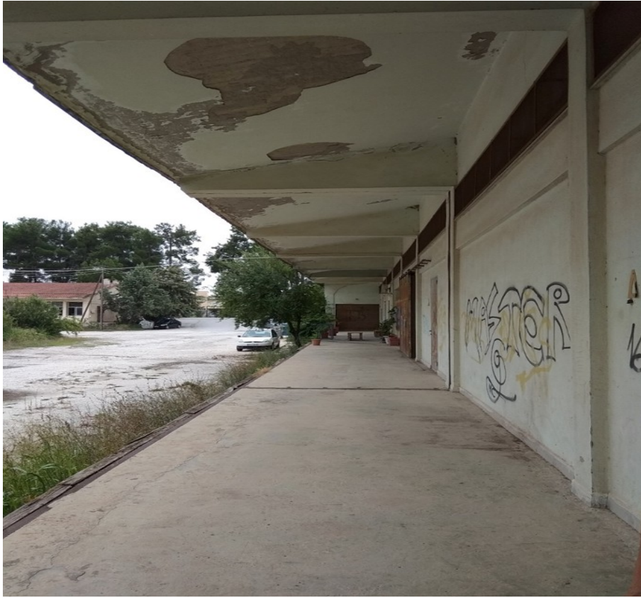
Εικόνα 3: Άποψη προστεγάσματος αποθήκης 1