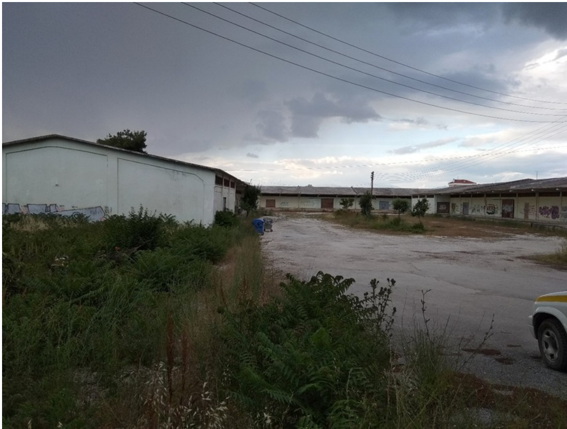
Εικόνα 1: άποψη αποθηκών 1,2,3 από οδό Θεοφράστου