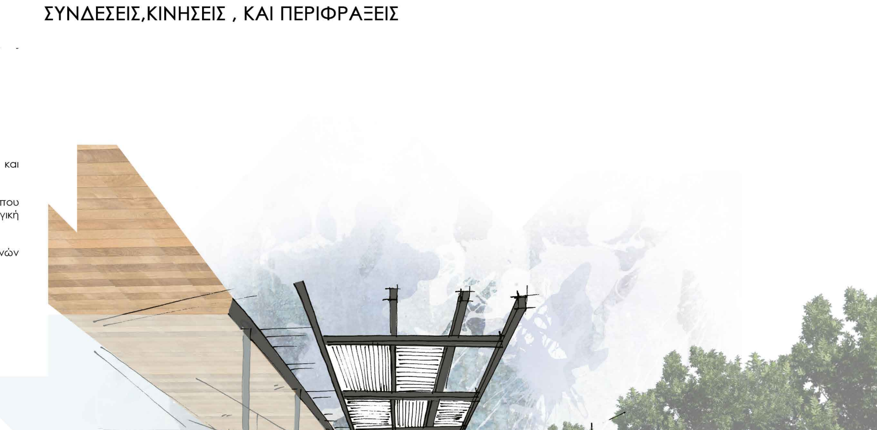
ΔΙΚΤΥΟ ΠΕΡΙΒΑΛΛΟΝΤΙΚΗΣ ΕΥΑΙΣΘΗΤΟΠΟΙΗΣΗΣ ΚΑΙ ΠΡΟΤΥΠΗΣ ΕΚΠΑΙΔΕΥΤΙΚΗΣ ΠΑΡΑΓΩΓΗΣ